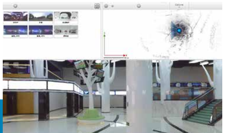
鸟巢内部在中国369会网的三维实景图。

而通过中国369会网，所有的候选会议场地都以三维立体完整地实景呈现出来，甚至还有尺寸参数，活动策划专员足不出户就可以轻松选择会议场地，这也是徐总最初的创意设想。