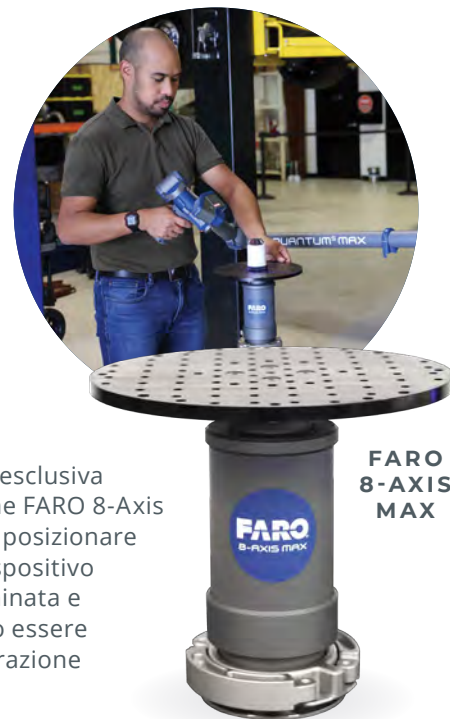
FARO 8-AXIS MAX

Ogni modello FARO Arm ha una portata fino al 25% più estesa, che offre un'articolazione più confortevole e un'estensione migliore al di sopra e intorno a oggetti più grandi posizionati all'interno del volume di lavoro specificato. In combinazione con l'esclusiva funzione di rotazione FARO 8-Axis Max, la necessità di posizionare o riposizionare il dispositivo è praticamente eliminata e le ispezioni possono essere completate in una frazione del tempo.